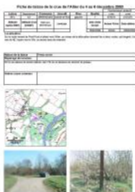
Vue de la fiche d'origine du repère en 2004

Altitude calculée de l'eau (en m) : 287.85 m