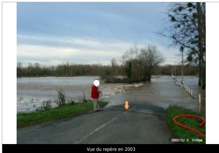
Vue du repère en 2003

Altitude calculée de l'eau (en m) : 272.81 m