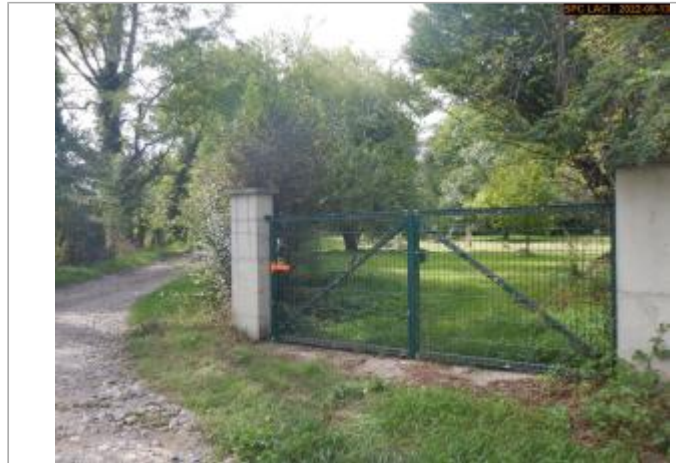
Vue du site (crue 12/2003)

Coordonnées WGS84 : X: 3.44910847 / Y: 45.97270776