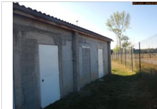
Vue du repère en 2022

Altitude calculée de l'eau (en m) : 374.52 m