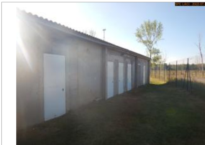
Vue du site en 2022

Coordonnées WGS84 : X: 3.28548829 / Y: 45.52224200