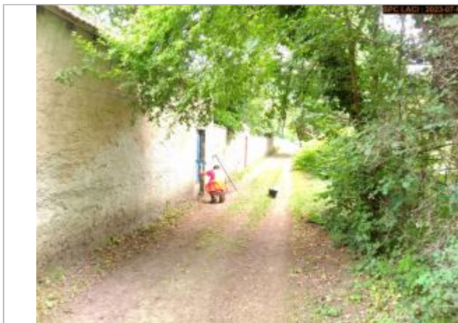
Vue du site en 2023

Coordonnées WGS84 : X: 3.26793328 / Y: 45.38790362