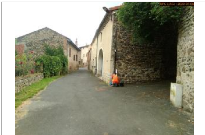
Vue du site en 2023 (crue 11/1994)