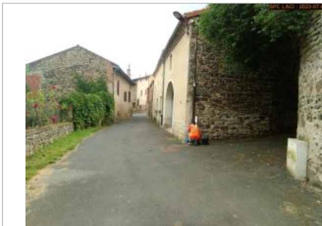
Vue du site en 2023 (crue 11/1994)