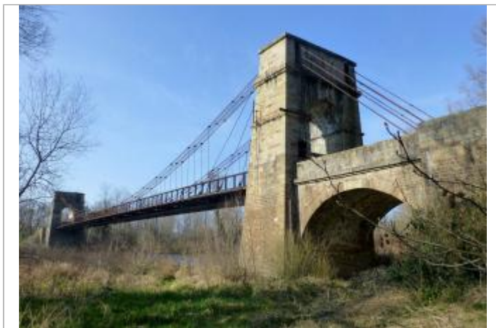
Vue du site éloignée

GÉOLOCALISATION Coordonnées WGS84 : X: 3.27624088 / Y: 45.54391730 Coordonnées RGF93 (Lambert 93) : X: 721556.24 / Y: 6493863.1 Coordonnées RGF93 (ETRS89) : X: 3.2762409 / Y: 45.5439173 Code Hydro: K---0080 Rive de référence: Gauche