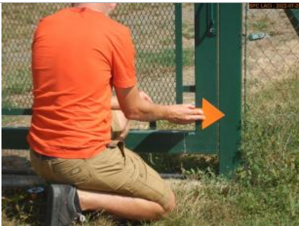
Vue du repère éloignée

Altitude calculée de l'eau (en m) : 410.891 m