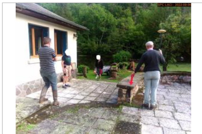
Vue du site éloignée (maison au N°1)

GÉOLOCALISATION Coordonnées WGS84 : X: 2.90780866 / Y: 46.02827330 Coordonnées RGF93 (Lambert 93) X: 692868.71 / Y: 6547617.78 Coordonnées RGF93 (ETRS89) : X: 2.9078087 / Y: 46.0282733 Code Hydro: K3--0200 Rive de référence: Droite