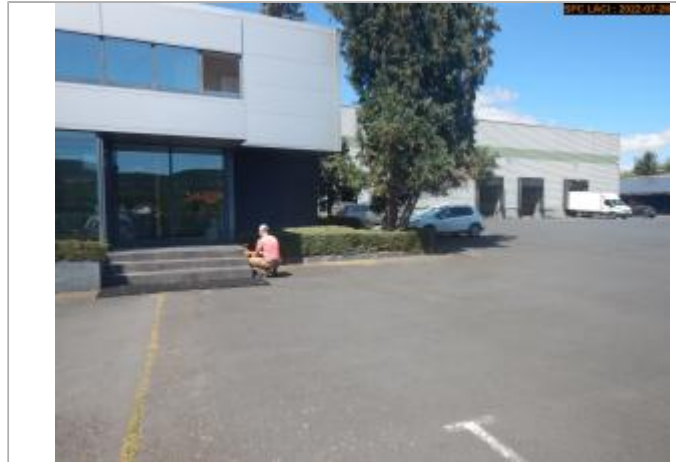
Vue du site éloignée

Coordonnées WGS84 : X: 3.32732503 / Y: 45.40675556