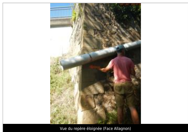
Vue du repère éloignée (Face Allagnon)

GÉNÉRAL Code : SPC_AL_R_0168_201 Date de mise à jour : 24/11/2022 Auteur : SPC Allier