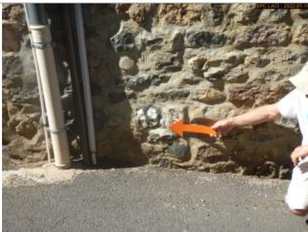
Vue du repère rapprochée

Altitude calculée de l'eau (en m) : 655.548 m