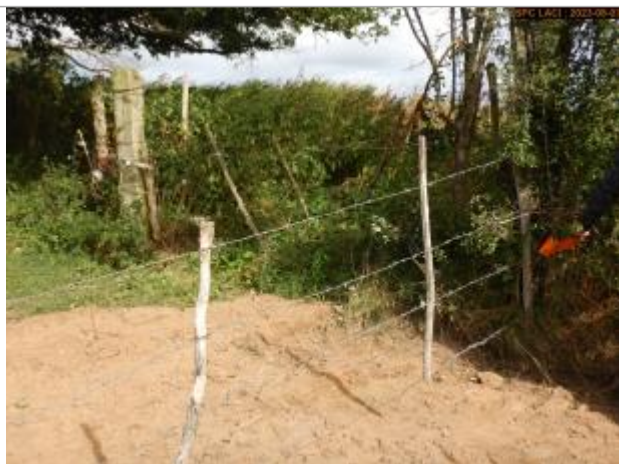
Vue du repère en 2023

Altitude calculée de l'eau (en m) : 196.031 m