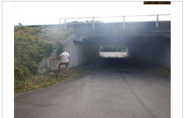
Vue du site (repère 2003)

Coordonnées WGS84 : X: 3.23966060 / Y: 45.58069120