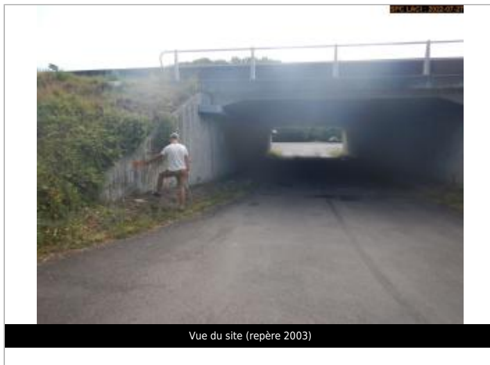
Vue du site (repère 2003)