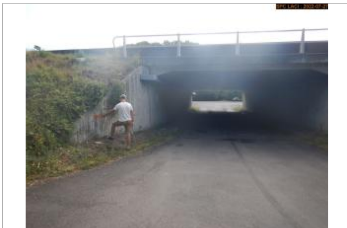
Vue du site (repère 2003)