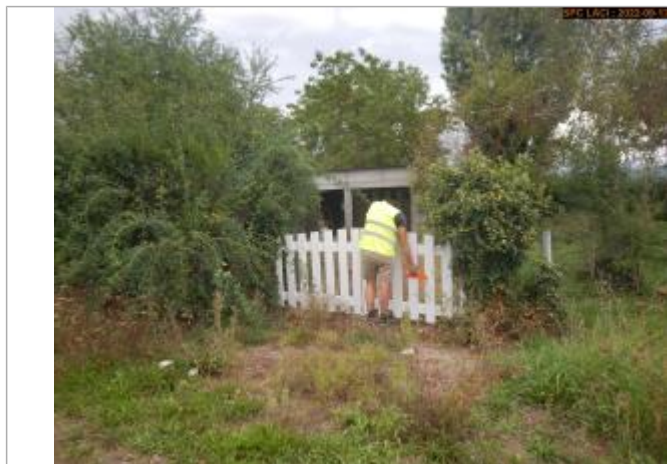
Vue du repère sur le portail (crue 12/2003)