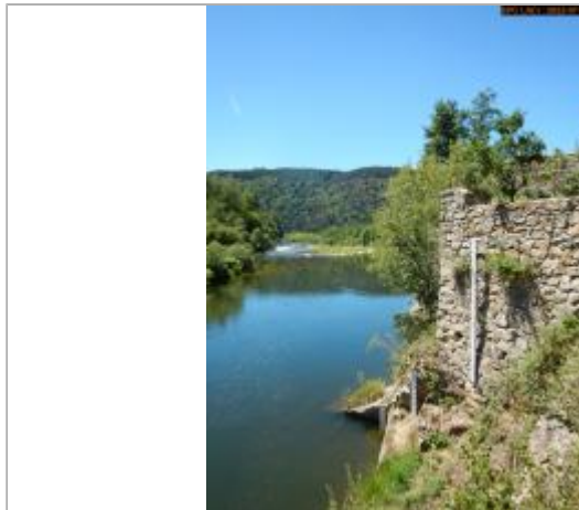
Vue du site éloignée