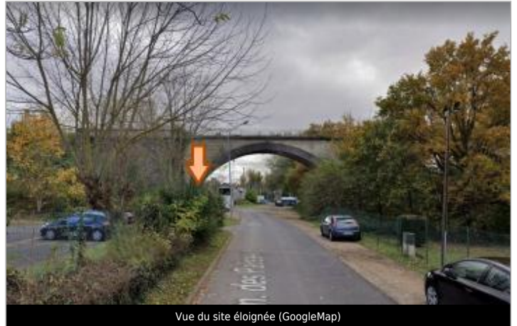
Vue du site éloignée (GoogleMap)