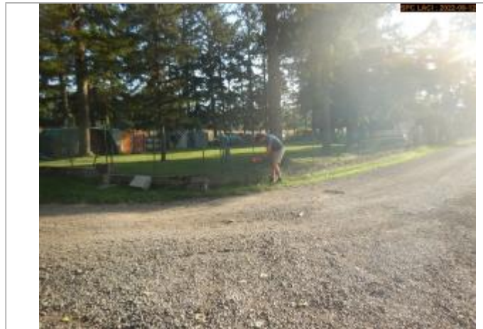
Vue du site éloignée

Coordonnées WGS84 : X: 3.28141150 / Y: 45.79110810