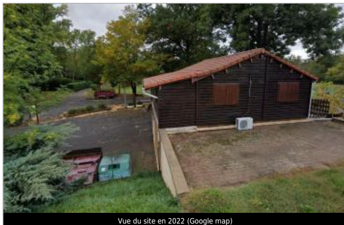
Vue du site en 2022 (Google map)