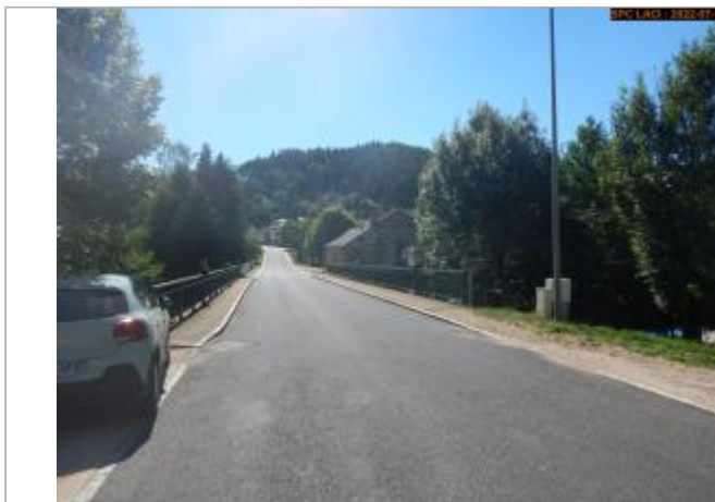
Vue du pont sur l'Ance