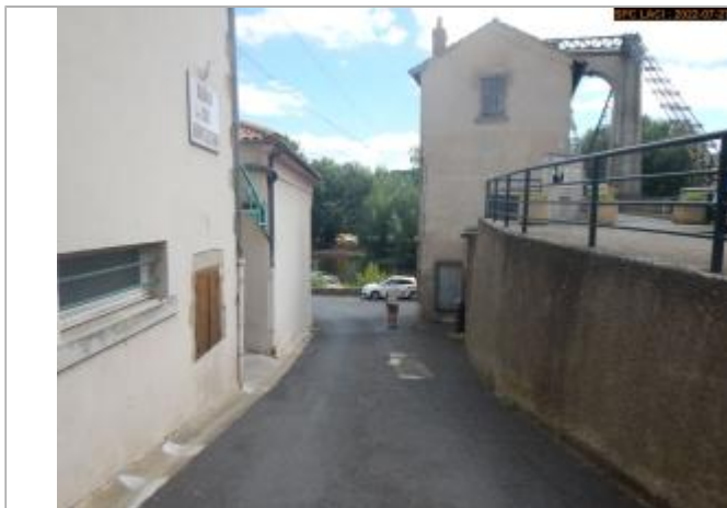
Vue du site éloignée (côté place de l'Église)