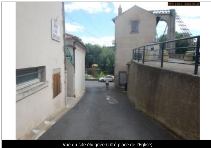
Vue du site éloignée (côté place de l'Eglise)