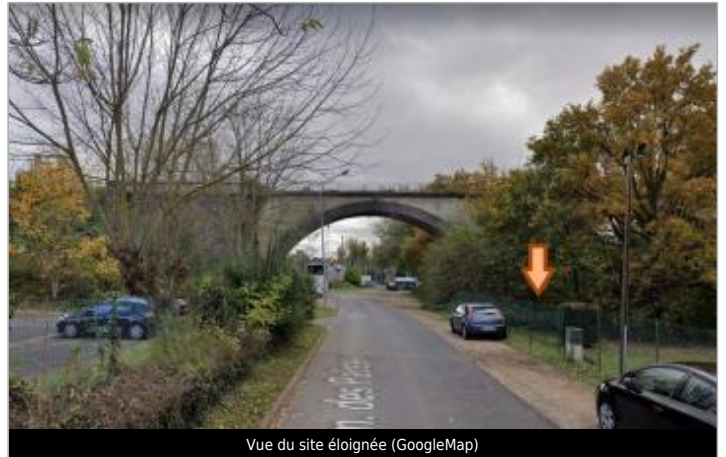
Vue du site éloignée

Coordonnées WGS84 : X: 3.24406720 / Y: 45.78840900