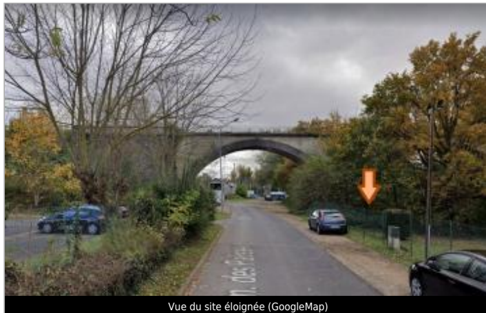
Vue du site éloignée (GoogleMap)