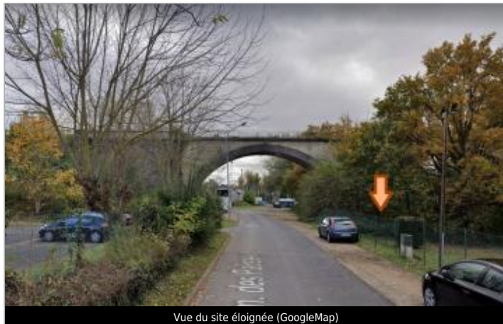
Vue du site éloignée (GoogleMap)