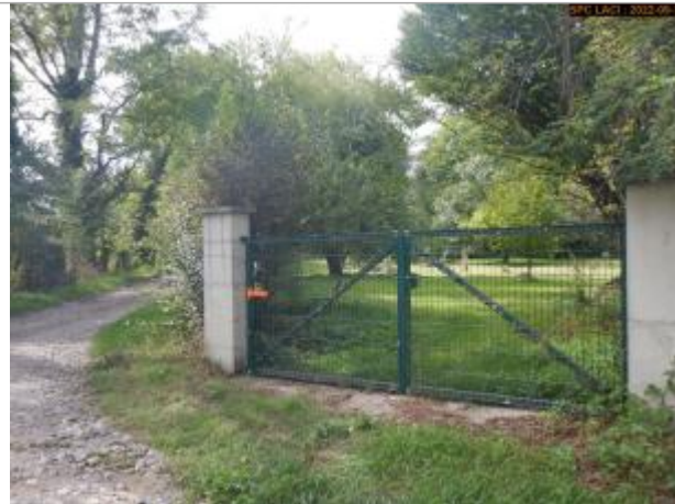
Vue du site (crue 12/2003)