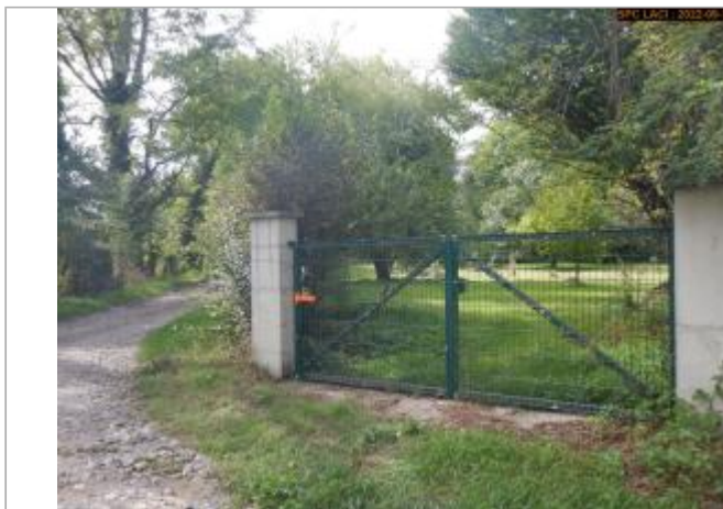
Vue du site (crue 12/2003)