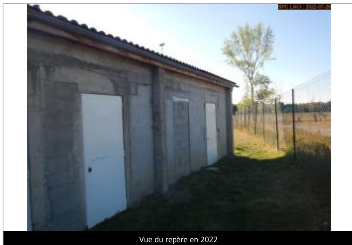
Vue du repère en 2022

Altitude calculée de l'eau (en m) : 374.45