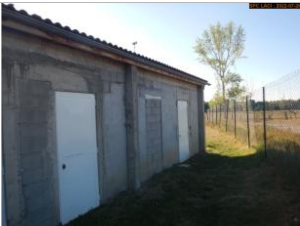
Vue du repère en 2022

Altitude calculée de l'eau (en m) : 374.45