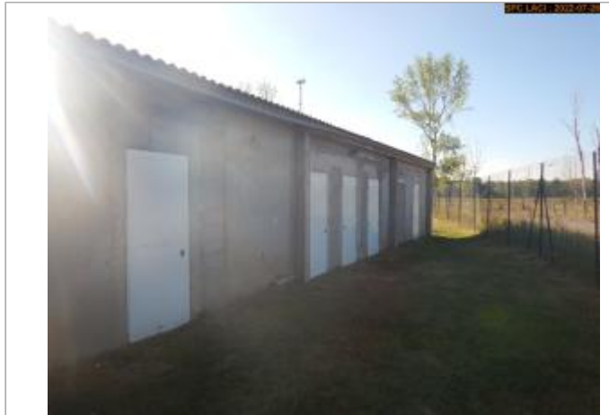
Vue du site en 2022

Coordonnées WGS84 : X: 3.28548829 / Y: 45.52224200