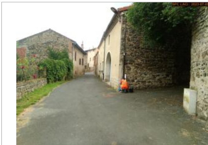
Vue du site en 2023 (crue 11/1994)