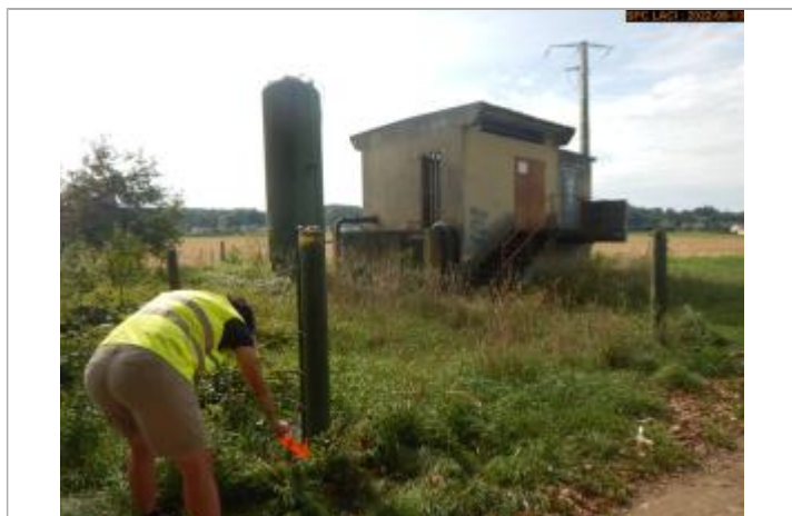
Vue du repère éloignée (poteau côté amont Allier)