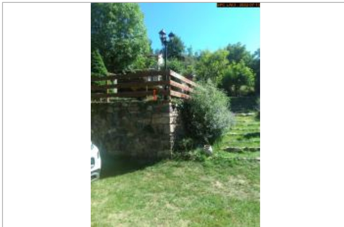
Vue du support éloignée (nouvelle référence)