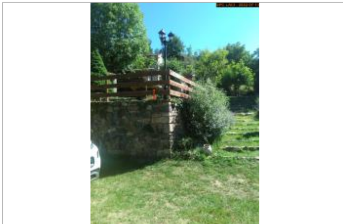
Vue du support éloignée (nouvelle référence)