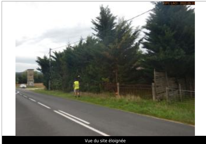
Vue du site éloignée