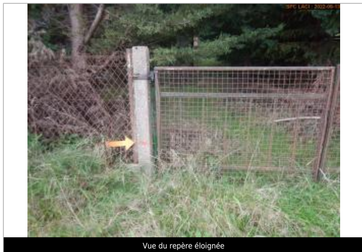
Vue du repère éloignée

Altitude calculée de l'eau (en m) : 267.235