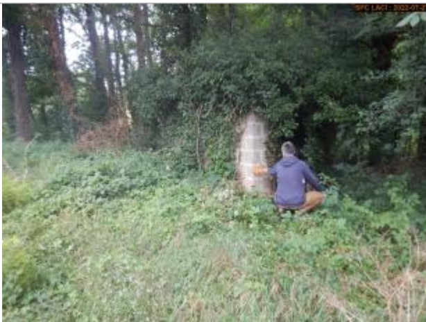
Vue du repère éloignée

Altitude calculée de l'eau (en m) : 370.46