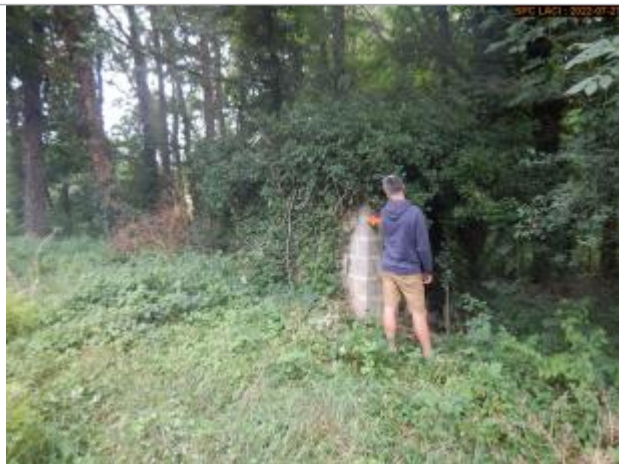
Vue du repère éloignée

Altitude calculée de l'eau (en m) : 371.24