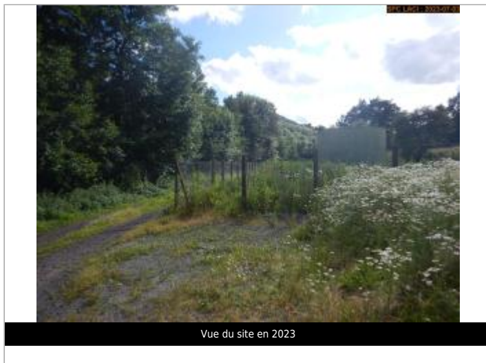
Vue du site en 2023