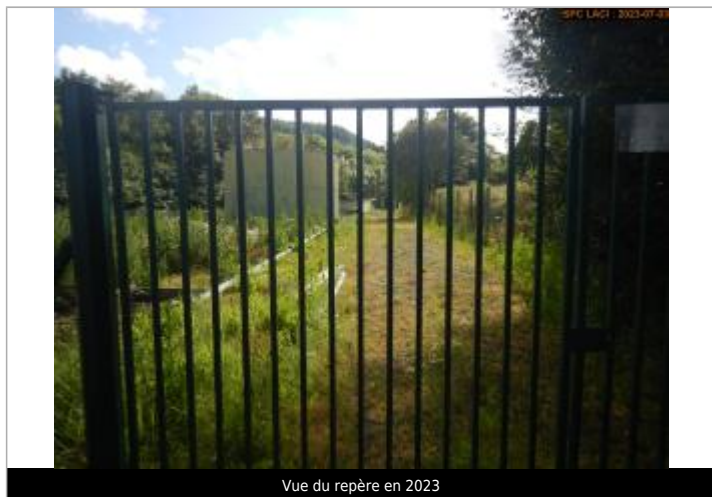
Vue du repère en 2023

Altitude calculée de l'eau (en m) : 781.7