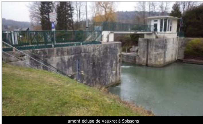
amont écluse de Vauxrot à Soissons