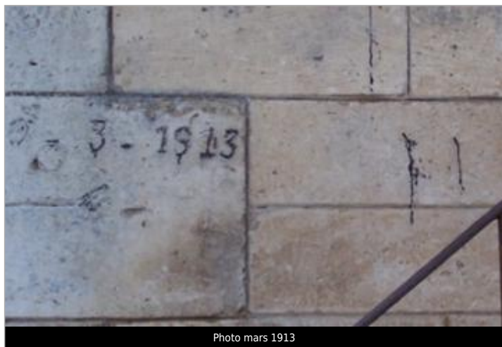
Photo mars 1913