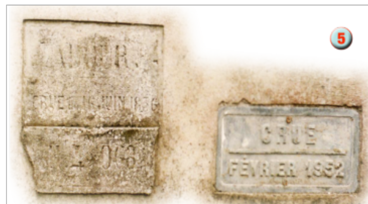
Vue des repères