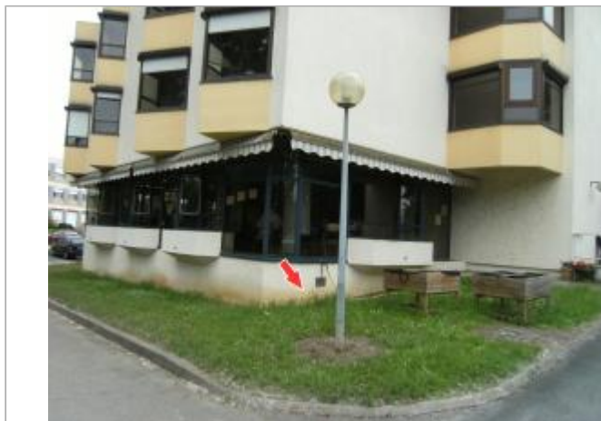
Site et repère de la crue de juin 2016