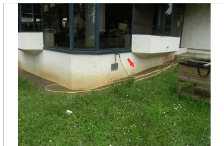
Repère de la crue de 2016