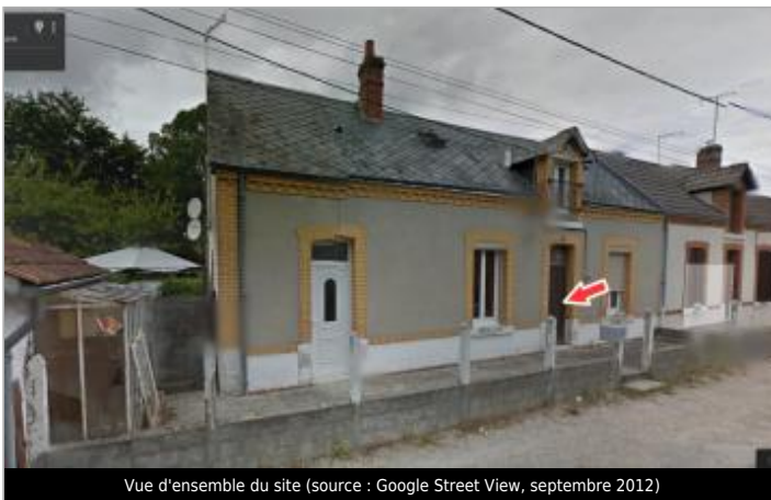
Vue d'ensemble du site

GÉOLOCALISATION Coordonnées WGS84 : X: 1.73789100 / Y: 47.35594400 Coordonnées RGF93 (Lambert 93) X: 604732.76 / Y: 6695829.19 Coordonnées RGF93 (ETRS89) : X: 1.737891 / Y: 47.355944 Code Hydro: K6-0250 Rive de référence: Gauche