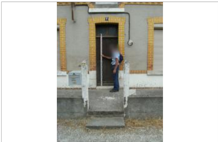
Repère de la crue de juin 2016

MARQUE Visibilité : Oui État du repère : Disparu Pérennité : Aucune