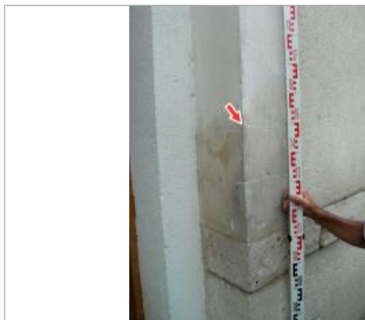
Repère de la crue de juin 2016