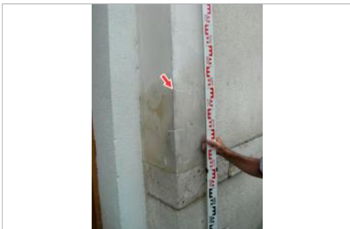
Repère de la crue de juin 2016

Visibilité : Non renseigné État du repère : Non renseigné Pérennité : Non renseigné