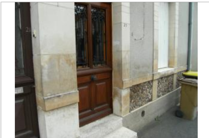
Site en juillet 2016

GÉOLOCALISATION Coordonnées WGS84 : X: 1.74034800 / Y: 47.35377600 Coordonnées RGF93 (Lambert 93) X: 604914.36 / Y: 6695585.43 Coordonnées RGF93 (ETRS89) : X: 1.740348 / Y: 47.353776 Code Hydro: K6--0250 Rive de référence: Gauche