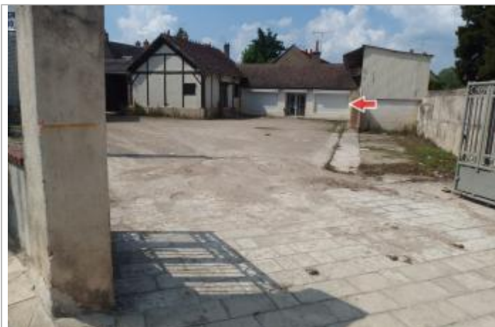
Site et repère de la crue de juin 2016