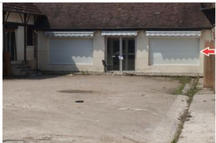
Repère de la crue de juin 2016