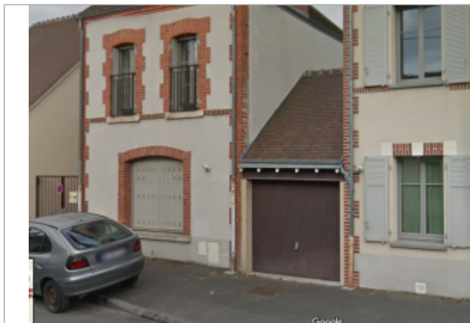
Vue d'ensemble du site