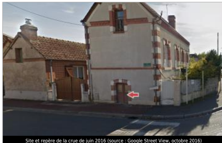
Site et repère de la crue de juin 2016