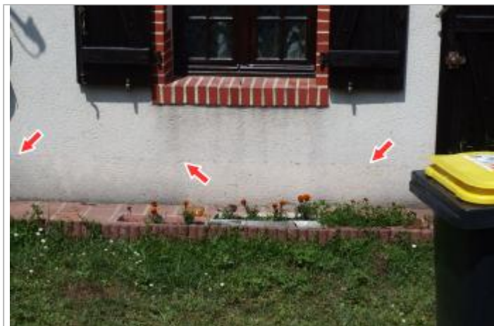
Site et repère de la crue de 2016