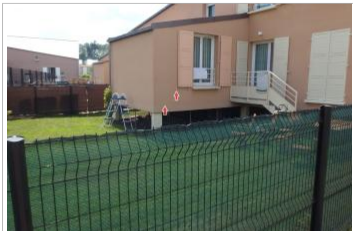
Site et repère de la crue de juin 2016