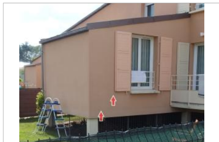
Repère de la crue de 2016