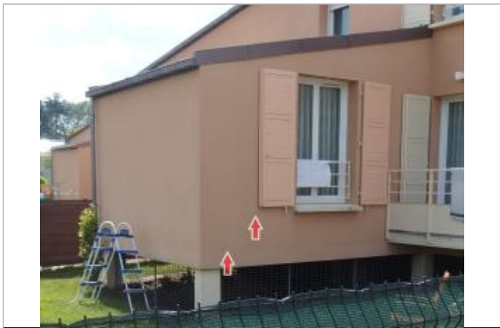
Repère de la crue de 2016

MARQUE Visibilité : Oui État du repère : Disparu Pérennité : Aucune