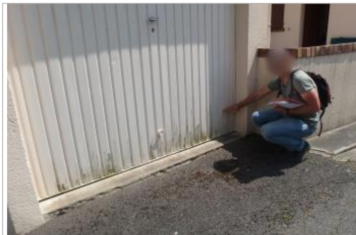
Site et repère de la crue de juin 2016