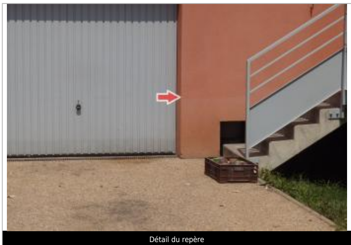
Détail du repère

MARQUE Visibilité : Oui État du repère : Disparu Pérennité : Aucune