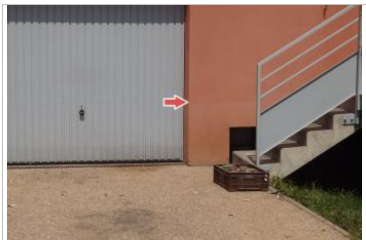
Détail du repère

MARQUE Visibilité : Oui État du repère : Disparu Pérennité : Aucune