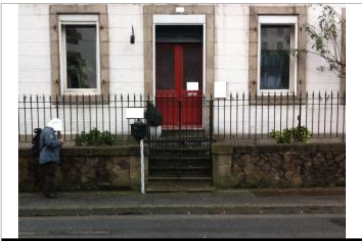
Muret clôturé de l'office notarial au 45 rue de Brest

GÉOLOCALISATION Coordonnées WGS84 : X: -3.83015810 / Y: 48.57519700 Coordonnées RGF93 (Lambert 93) : X: 196767.55 / Y: 6852331.59 Coordonnées RGF93 (ETRS89) : X: -3.8301581 / Y: 48.575197 Code Hydro: J2614000 Rive de référence: Gauche