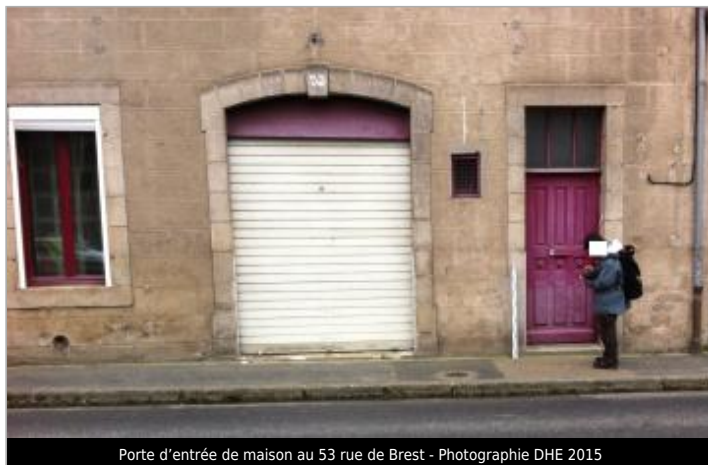
Porte d'entrée de maison au 53 rue de Brest