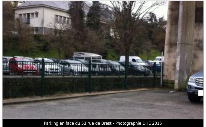
Parking en face du 53 rue de Brest - Photographie DHE 2015