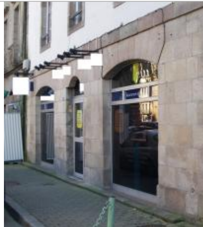
Bâtiment 12 Place Cornic - Photographie DHE 2015