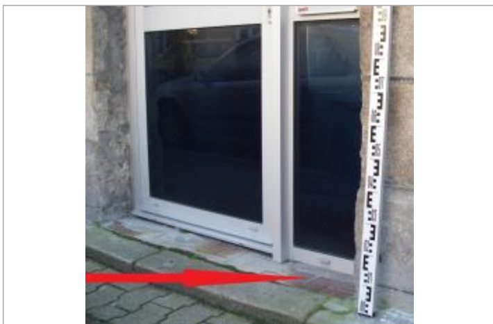
Seuil à l'entrée de l'agence

Altitude calculée de l'eau (en m) : 5.72 m