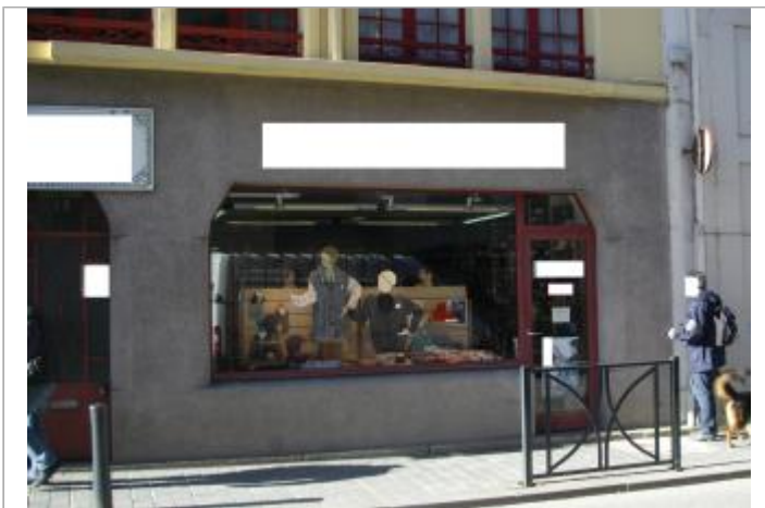
Magasin 13 Rue de Brest

GÉOLOCALISATION Coordonnées WGS84 : X: -3.82845040 / Y: 48.57653300 Coordonnées RGF93 (Lambert 93) X: 196905.89 / Y: 6852468.68 Coordonnées RGF93 (ETRS89) : X: -3.8284504 / Y: 48.576533 Code Hydro: J2614000 Rive de référence: Gauche