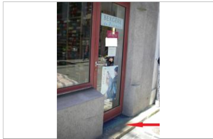
Seuil de la porte d'entrée du magasin - Photographie DHE 2015

MARQUE Maximum de l'inondation : Oui Visibilité : Oui État du repère : Moyen Pérennité : Aucune Repère calculé : Non PHÉC : Non